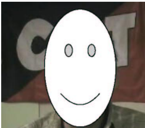
avec « oreilles de Mickey »

Dans le cas d'une personne que tu interviewes devant une affiche que tu souhaites que l'on voit en arrière-plan comme décor, une seule solution : le « plan / contre-plan ». Pour toi, cette technique consiste ici à déplacer la personne interviewée d'un point à l'autre de l'affiche et dans le cadre. Cela pour éviter que le personnage se retrouve centré à l'écran avec ce que l'on nomme des « oreilles de Mickey » de chaque côté de la tête.