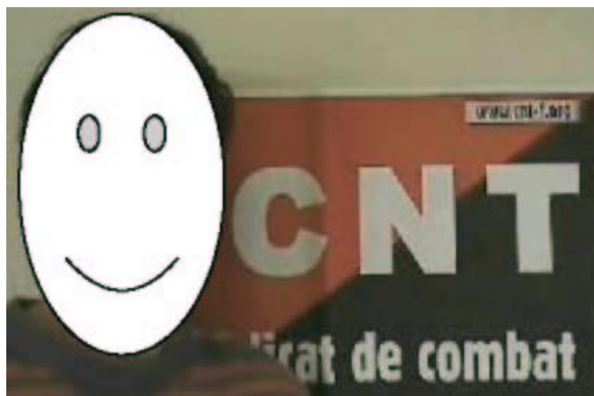
sans « oreilles de Mickey »

Tu obtiens ainsi à l'image une lecture partielle mais complète de l'affiche. Cette technique toute simple permet d'obtenir un pré-montage dynamique et simple de réalisation.