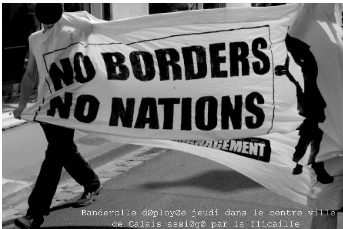
Banderolle d'oploye jeudi dans le centre ville de Calais assiogé par la flicaille