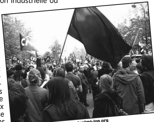
1er Mai 2004 à Paris

Aussi la CNT a-t-elle dès à présent une pratique syndicale qui dépasse la cogestion frileuse de la société telle qu'elle est. Il s'agit, bien entendu de défendre les intérêts immédiats des salariéEs mais aussi d'ébaucher dès maintenant un autre futur, en adoptant une méthodologie syndicale en rupture avec les schémas hiérarchiques qui régissent notre présent.