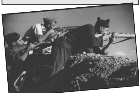
Espagne 1936.

Contrairement à la plupart des pays occidentaux, la bolchevisation des courants révolutionnaires suite à la révolution russe n'est pas parvenue à absorber celui espagnol. Le syndicalisme espagnol s'est ainsi affirmé en inventant le projet de société communiste libertaire : la reconnaissance du groupe humain, et non de l'individu, comme base d'organisation sociale, mais selon des principes autogestionnaire, sans délégation de pouvoir. Les collectivités d'Aragon et d'ailleurs ont été la réalisation historique de la CNT hégémonique (2 millions d'adhérents) dans la période révolutionnaire de 1936-39.