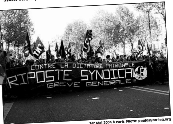
1er Mai 2004 à Paris

Le nom de la CNT circule désormais régulièrement, sur les tracts, dans les manifestations, parfois dans les médias. Mais si les trois lettres commencent à être connues, ce qu'elles signifient reste souvent bien flou. Plusieurs éléments concourent à cela. " Confédération nationale du travail " indique bien qu'il s'agit d'un syndicat, pour le reste les termes ne sont guère explicites ; et comportent un " nationale " bien peu opportun, de nos jours, en France. Ensuite, les références de la CNT, syndicalisme révolutionnaire, anarchosyndicalisme, laissent souvent la place à un " anarchisme " qui ne lui correspond pas forcément. Enfin, son image sulfureuse, teintée d'une violence que les médias présentent volontiers comme gratuite, trouble la perception extérieure de sa réalité militante. L'existence d'une autre " CNT ", survivance d'ancienne scission, contribue également, lorsqu'on s'intéresse à la CNT, à en compliquer l'appréhension. Alors, la CNT, c'est quoi ?