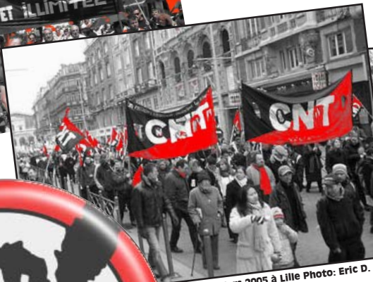
Mars 2005 à Lille