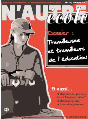
N'Autre école est diffusé dans les librairies militantes, auprès des syndicats CNT ou par abonnement (20 € pour 5 n°). Chèques à l'ordre de CNT-FTE / à envoyer à N'Autre école C/o CNT-FTE, 33 rue des Vignoles 75020 Paris

N'Autre école en est à son 16 ème numéro, qu'est-ce qui a motivé le lancement de cette revue ?