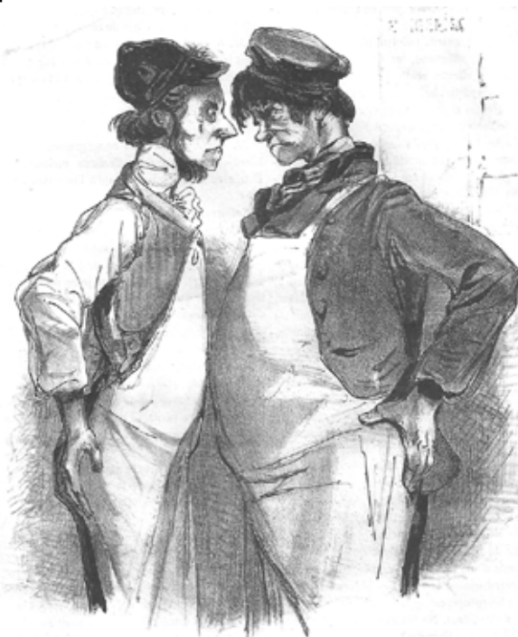
« Funestes effets de la concurrence commerciale » (1840)

Au final, ce sont bien les aménageurs qui profitent de cette crise dont pâtissent par contre l'ensemble des archéologues, quel que soit leur employeur. Ils le payent par des conditions de travail en constante dégradation, par une précarité toujours plus forte et par une dépréciation de leur métier à leurs yeux. Enfin, c'est l'ensemble de la communauté qui paye l'addition, d'abord d'un point de vue financier, puisque ce sont les impôts, via le CIR ainsi détourné, qui financent le dumping généralisé dans le secteur des fouilles, d'un point de vue patrimonial ensuite, par la fouille et l'étude de plus en plus sommaire de sites archéologiques irrémédiablement détruits.